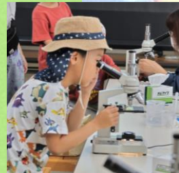
顕微鏡をのぞいてみよう プレパラートの世界へ