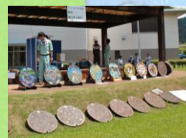
今年もやります マンホール蓋 展示販売

当日のお問い合わせ クリーンピア千曲 長野市大字赤沼 字申高2455 TEL 026-257-4000