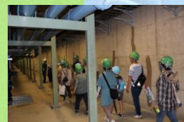
夏でも冷房いらず 地下の迷宮へ