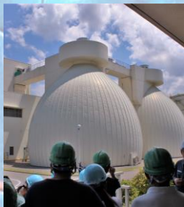
たまご？ 玉ねぎ？ なにこれデカすぎる！