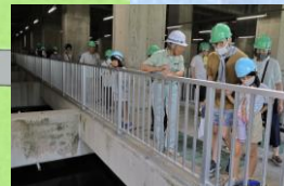
水がきれいになる 様子がわかるよ