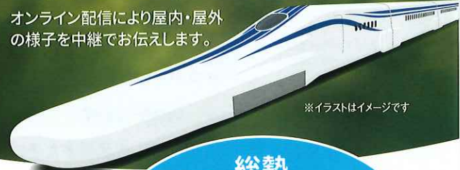
※イラストはイメージです

2023. 10/28(土)・29(日) 10:00～16:00 エス・バード(飯田市座光寺3349-1)