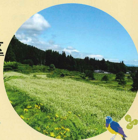
季節によって楽しめる 里山文化ゾーンの蕎麦畑