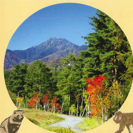
10月になると色づき始める 園内の紅葉

公園で活動する市民の皆さまだけでなく、 生物多様性に関心のある皆様も 是非ご参加ください！