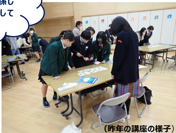
(昨年の講座の様子)

体験型シミュレーションゲームを通して、SDGs が大切にしている考え方を学び、地域活性化／地方創生に活かす方法を探りながら、持続可能なまちづくりを体験します。