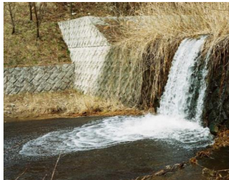
砂防ダム改修前(2008年)