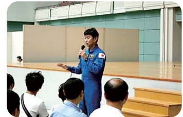
【信州環境カレッジ キックオフ講座】の様様 (平成30年7月29日 長野市)

「信州環境カレッジ」 オリジナルグッズのほか、 JAXA宇宙飛行士 油井亀美也さんの サイン入り色紙を 抽選で10名に プレゼント!